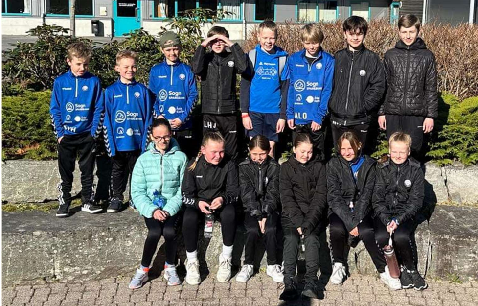
Flotte og kjekke ungdommer å ha med på tur!

Endelig ble det arrangert turnstevne etter korona pausen. De turnerne vi har på turn denne våren har aldri hatt muligheten å delta på stevne. Det samme gjelder våre nye trenere. Det er et helt nytt opplegg på dette stevnet, eller Gymfest i Vest (GIV) som det nå heter.