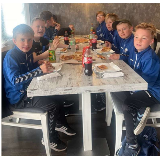
Pizza er godt!

Vi spiste pizza i stryn før vi reiste hjem.