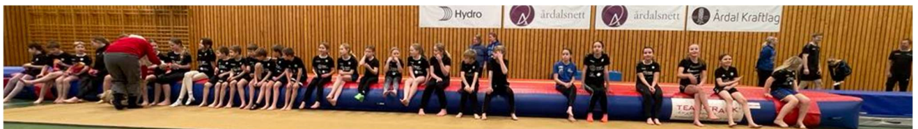
Nissen deler ut pakker til flinke turnere. 😊

Alltid kjekt og den spreke nissen kommer trofast på besøk med en liten pakke til ungene.