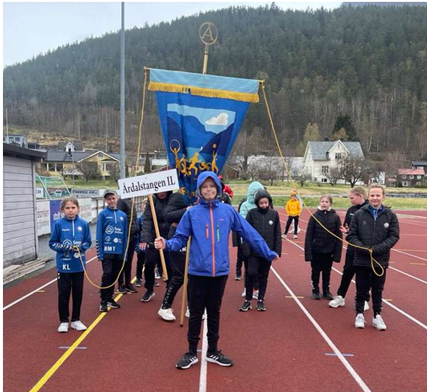
Oppstilt til defilering på turnstevnet i litt ruskete vær. Men like blide. <3