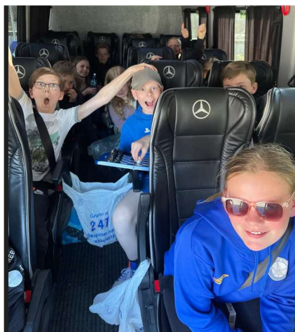
God stemning i bussen. ☺