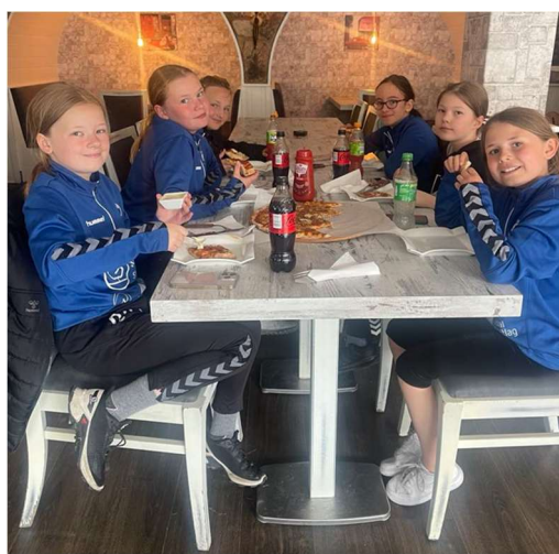
Nå koser vi oss!

Det ble en kjekk helg med kjekke ungdommer!