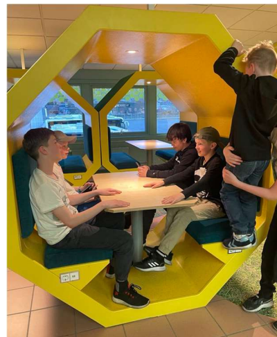
Sosialt og kjekt å overnatte på skole.

Det nye opplegget gikk ut på å ha litt læring på stevnet, her kunne de være med trampett, tumbling, dans eller parkour. Flere valgte parkour, noe nytt og spennende for dem. Resten var på trampett og tumbling i Stryn sin flotte, nye turnhall.